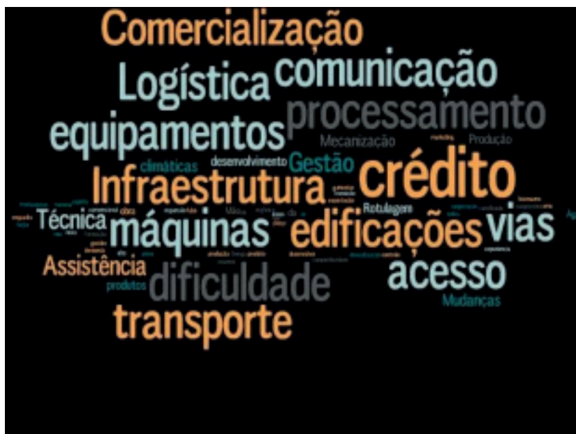
Fig.1 – Nuvem de Palavras – Desafios apontados pelos/as Dirigentes das Cooperativas – Região Sul.