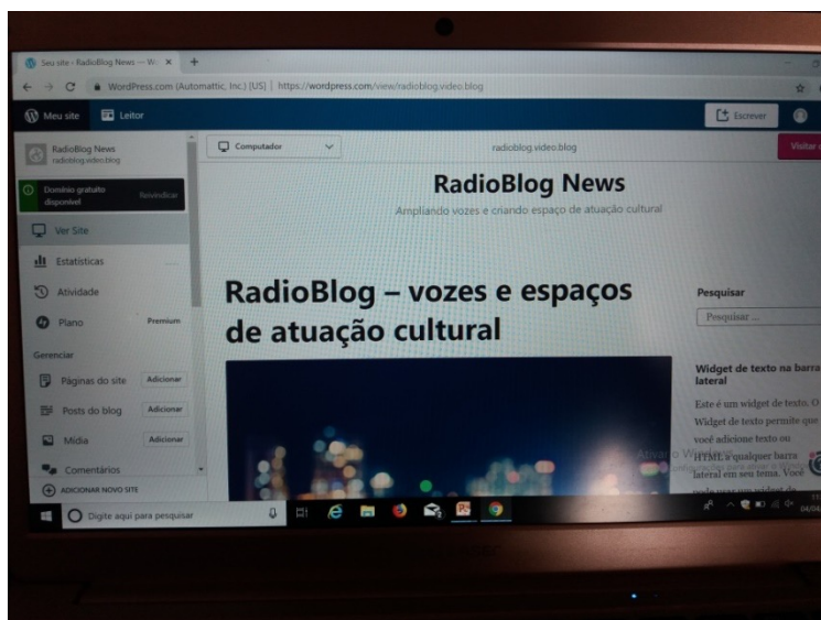
Figura 7: Página na internet “radioblog”.