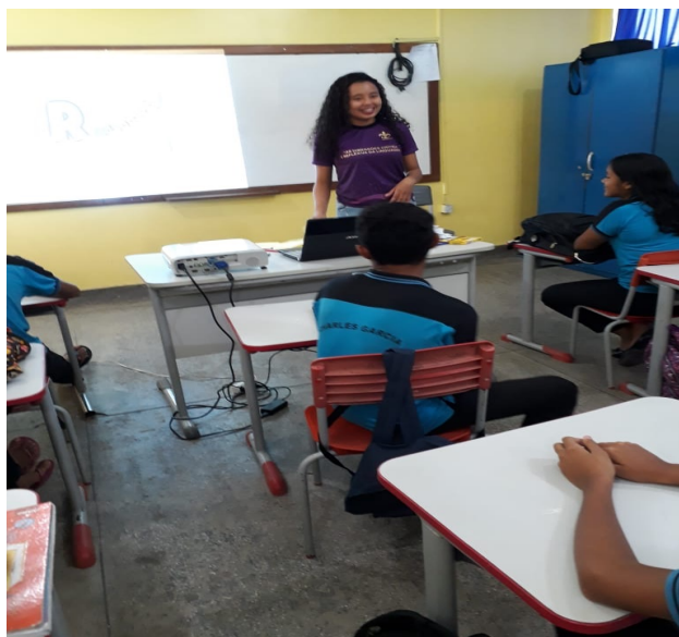
Figura 1: Roda de conversa com os alunos.