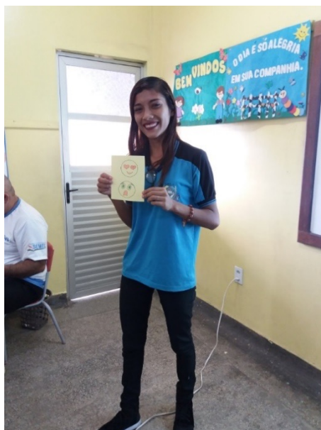
Figura 4: Aluna apresentando os seus emojins

As ações pedagógicas da escola têm se modificado ao longo de tantos avanços da sociedade e da tecnologia assumindo papel importante nessas mudanças e nas relações sociais e de cidadania. Com a utilização de ferramentas tecnológicas na educação, o professor tem a possibilidade de realizar aulas mais atrativas de acordo com a realidade dos alunos. A figura abaixo mostra essa possibilidade realizada durante oficina proposta em sala de aula.