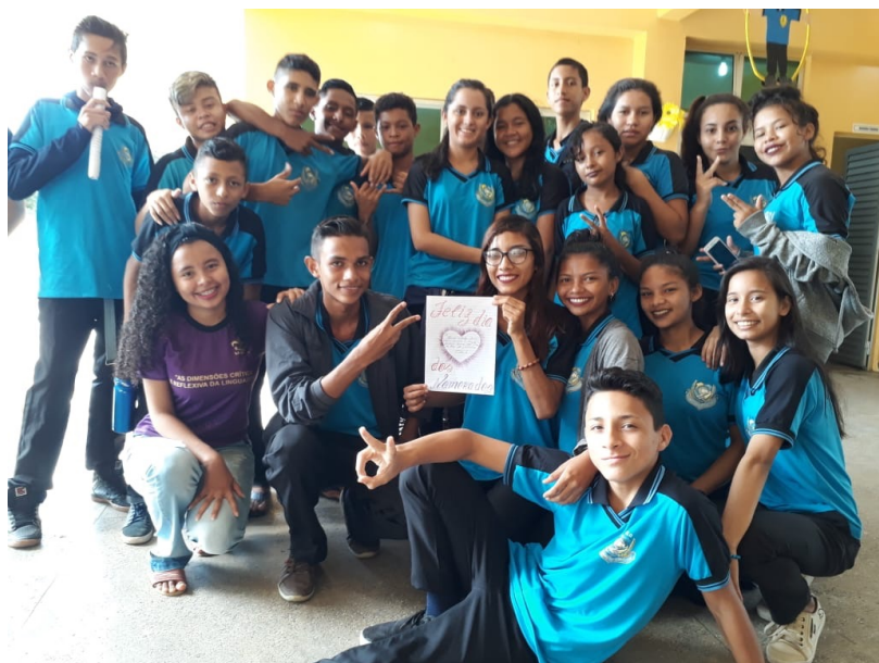
Figura 8: Após a transmissão de rádio.