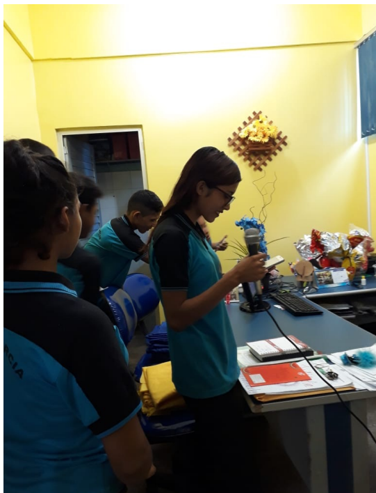
Figura 6: Aluna transmitindo a programação de rádio (Rádio Garcia) para toda a escola.