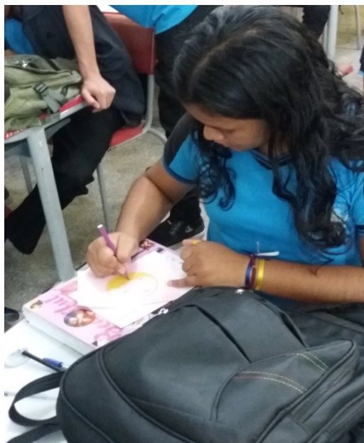
Figura 3: Aluna confeccionando o seu emoji.

ou sentimento do momento. Além de ser uma linguagem rápida, que está presente no contexto social dos alunos, foi uma ótima forma didática para estimular a leitura e produção deles, como também a participação de todos, pois foi algo atrativo aos olhos desses alunos. Conforme apresentado na figura 3.