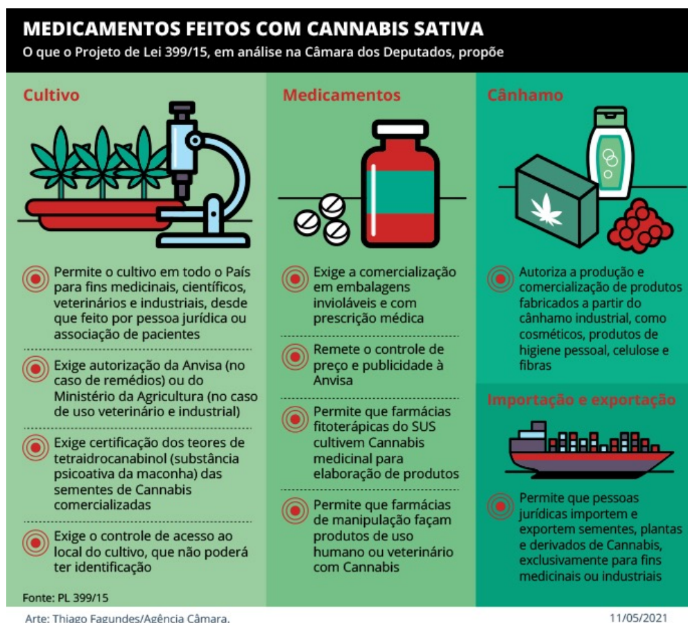
Figura 1 – Proposta do projeto de lei 399/15